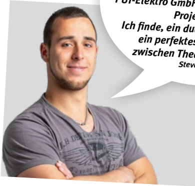
INGENIEUR FÜR ELEKTROTECHNIK/ AUTOMATISIERUNGSTECHNIK (BACHELOR OF ENGINEERING)