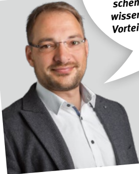
BETRIEBSWIRT (BACHELOR OF ARTS)

„Nach Beendigung meines Studiums der Sozialen Arbeit begann ich bei der Caritas in Eisenach als Familienpädagogin zu arbeiten. Mittlerweile leite ich den Bereich der Flexiblen Ambulanten Erziehungshilfen. Das Studium an der DHGE hat mich für den beruflichen Alltag gewappnet.“