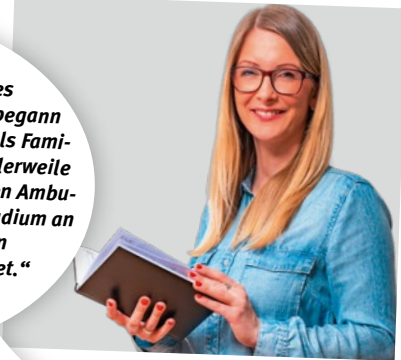
SOZIALPÄDAGOGIN (BACHELOR OF ARTS)