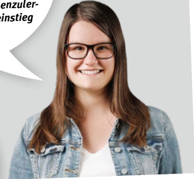
MASCHINENBAUINGENIEURIN (BACHELOR OF ENGINEERING)

„Ich habe meinen Abschluss als Ingenieur im Studiengang Elektrotechnik/Automatisierungstechnik gemacht und arbeite seitdem bei der Firma PUI-Elektro GmbH in Gera als Bau- und Projektleiter.