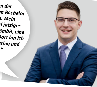
INFORMATIKER (BACHELOR OF SCIENCE)

„Ich bin Geschäftsführer der Städtischen Wohnungsgesellschaft Altenburg mbH und habe mein duales BWL-Studium in Gera absolviert. Aus meiner Sicht profitieren Absolventen der DHGE aufgrund ihres theoretischen Wissens und der erlernten wissenschaftlichen Methoden von Vorteilen in der Karriereplanung.“